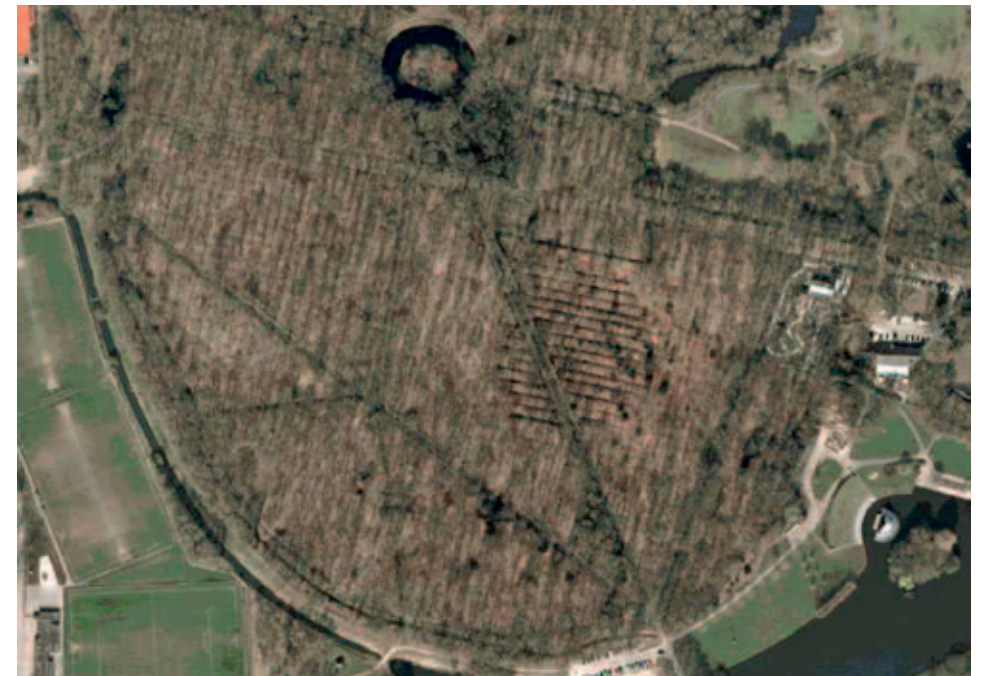
In het zuidelijk deel van de warande is nog de ronde vorm met rabatten herkenbaar, die moet dateren uit de periode vóór de aanleg van het padenstelsel

De huidige Warande beslaat circa 30 bunders. Er staan nog steeds eiken en beuken, maar er zijn ook nieuwe aanplantingen gedaan. Op een met sierheesters en hoge bomen beplant eilandje bevinden zich enige graven en een grafkelder van de Helmondse familie Wesselman. Kruinen van bomen weerspiegelen in het water dat de begraafplaats omringt. De vele lommerrijke dreven die het wandelpark kent, komen hier als een centraal punt bijeen.