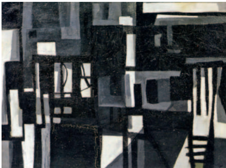
Stad, olieverf op linnen 1956. (Collectie Waterschap De Dommel, Boxtel)