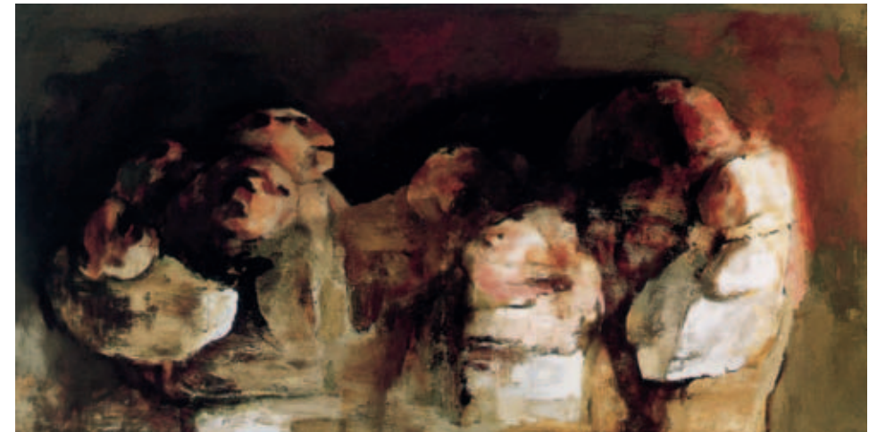
Figuren met twee kinderen, olieverf op linnen 1970/1972. (Collectie Rijksdienst Beeldende Kunst 's-Gravenhage)

De derde fase begon in 1978. Voor Jan van Eyk bestond voor een schilder alleen maar de schilderkundige weg. Tot in de eerste helft van de jaren vijftig was een beeldende kunstenaar naast intellectueel eigenaar van het werk ook de uitvoerende producent. Maar, de scheiding tussen het feitelijke artistieke proces en het in stand houden van het dagelijkse bestaan kreeg in de jaren zestig een verlengstuk in wat genoemd mag worden