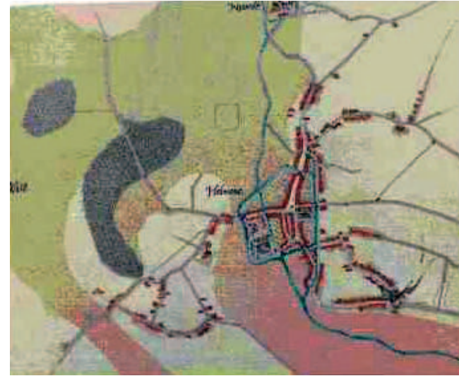
Kaartje van Helmond omstreeks 1540, getekend door cartograaf Jacob van Deventer, waarop het oude en het nieuwe bos duidelijk staan ingetekend. (Collectie Heemkundekring Helmont)

wordt het omschreven als zijnde een wildernis, circa 100 bunder groot en gelegen: ‘Inde parochie van Helmont mitter eender sijden aan de goederen des heeren van Meyerle ende neven een strate ende aan de andere streckende mitten eynde opten weert ende op die beempden van Stiphout mitten andere eynde’.