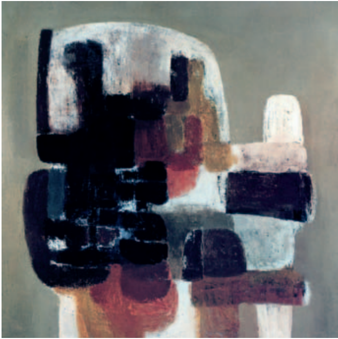
Figuur, olieverf op linnen 1961/62.