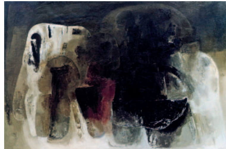
Het gezin, olieverf op linnen 1965. (Collectie Stedelijk Van Abbemuseum Eindhoven)

Jan van Eyk voornamelijk uit tekeningen, omdat hij geen toegang had tot materieel om te schilderen. Hij werkte in de trant van de Vlaamse expressionist Constant Permeke.