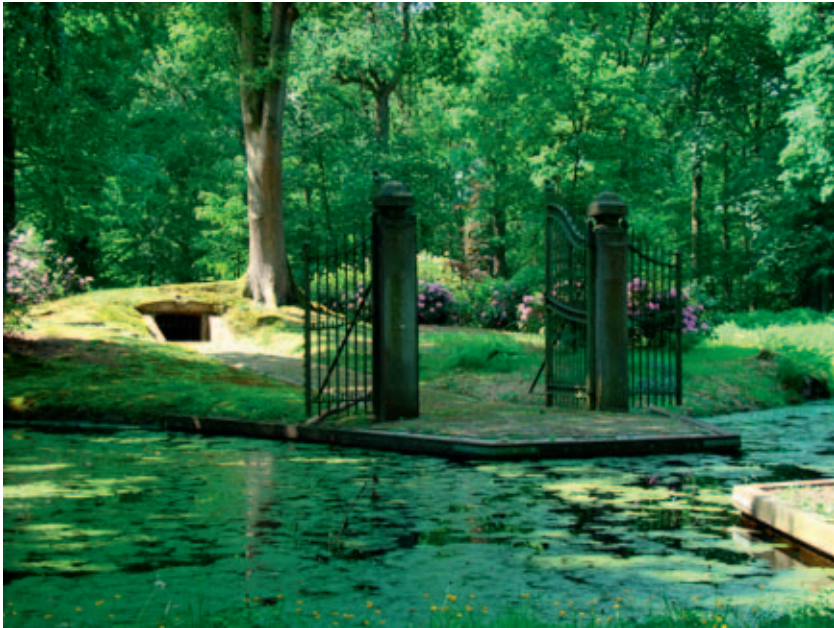
In de Warande bevindt zich de laatste rustplaats van de familie Wesselman. Brede kruinen van bomen weerspiegelen in het water van de omliggende gracht.

180 cm uit baksteenpuin te bestaan. Aan de resten is geen mortel aangetroffen, dus zijn ze niet uit een bouwwerk afkomstig. Het is daarom aannemelijk dat het resten van misbaksels betreft van de onderhavige steenoven. In 1585 leverde de inrichting 136.000 stenen op, die voor 5 gulden per 1000 stuks werden verkocht. De steenbakker ontving voor elke 100.000 stenen 30 gulden voor het leemgraven en 110 gulden voor het vormen. Jaarlijks werden twee porties gebakken. Na het bakken van een portie was het gebruikelijk dat aan de bakker, zijn vrouw en zijn kinderen, een 'blijde maaltijd' werd aangeboden.